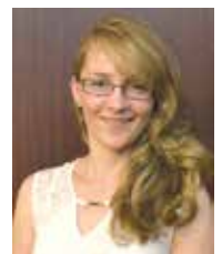
Лана Вівант, HOG SLAT, Україна

Особливий склад цементу дозволяє Con-Korite X'tra швидко тверднути без усадки, що забезпечує зна-