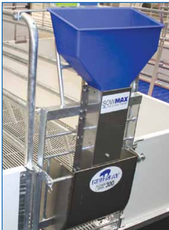
Фото 2. SowMAX - кормушка для свиноматок «ВВОЛЮ»