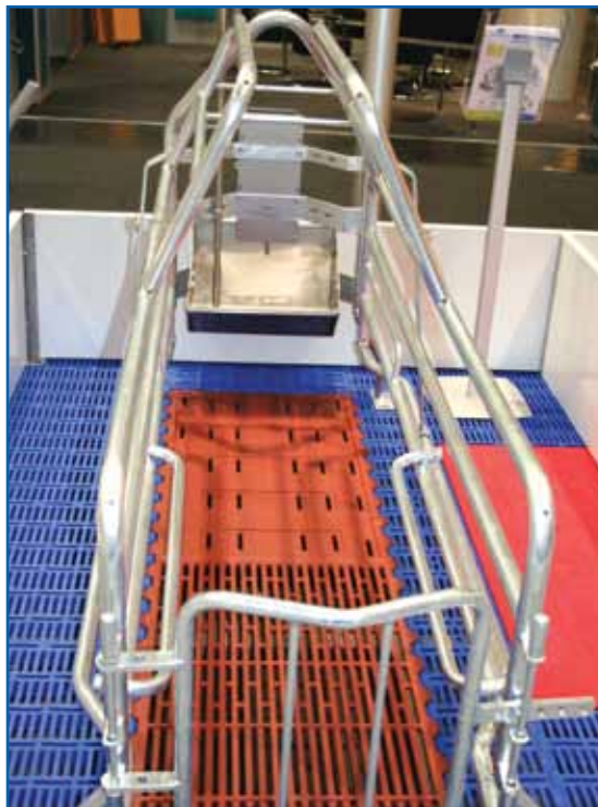
Фото 1. Станок для опороса, новая конструкция