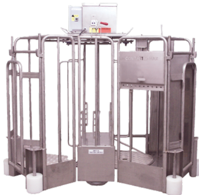
Фото 3. Contact-O-Max для оптимального оплодотворения свиноматок