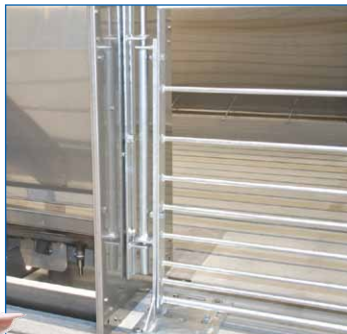
Фото 4. Загоны из оцинкованных стержней – благоприятные условия для вентиляции