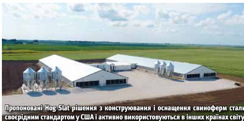
Пропоновані Hog Slat рішення з конструювання і оснащення свиноферм стали своєрідним стандартом у США і активно використовуються в інших країнах світу.